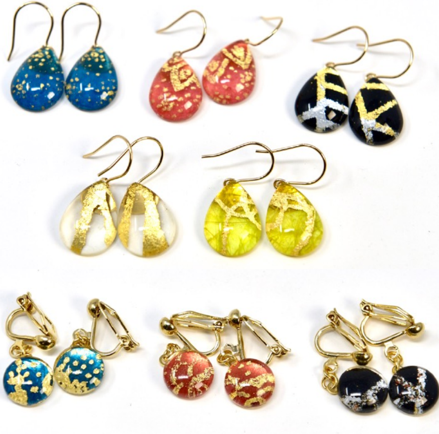
ゆらりイヤリング しずく Drop earring Shizuku 12mm x 18mm x 5mm